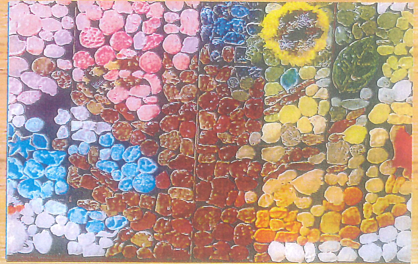
平成 26 年度 愛護ギャラリー 県育成会 会長賞 受賞作品