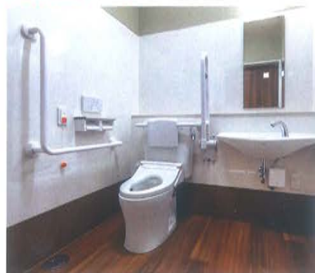
トイレ 1ユニットに3カ所完備しています。