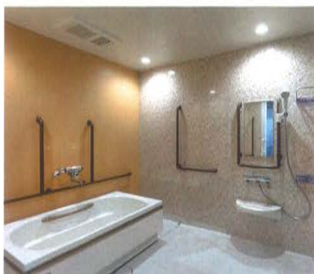
浴室 特浴室、個浴室、機械浴など完備しています。