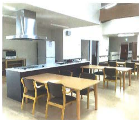
ユニット それぞれのユニット内に、皆さんが集う明るく開放的なリビングがあります。