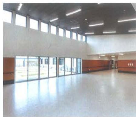
多目的交流スペース 各種イベントや地域交流の場に。